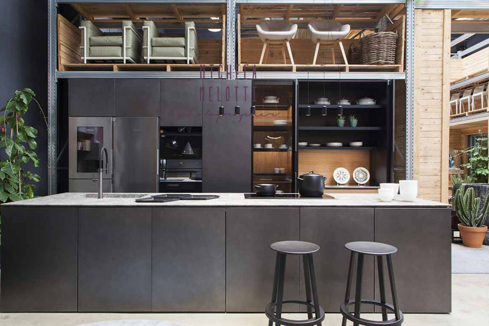
Sopra: stile e innovazione nella cucina minimal con l'inserimento dei prodotti Miele e V-Zug. A sinistra: Flexform, Lago e Flos: un cocktail vincente per un risultato di grande impatto. A destra: altro scorcio dello showroom di Dot Design. In primo piano divano e poltrona B&B e tavolini De Padova.