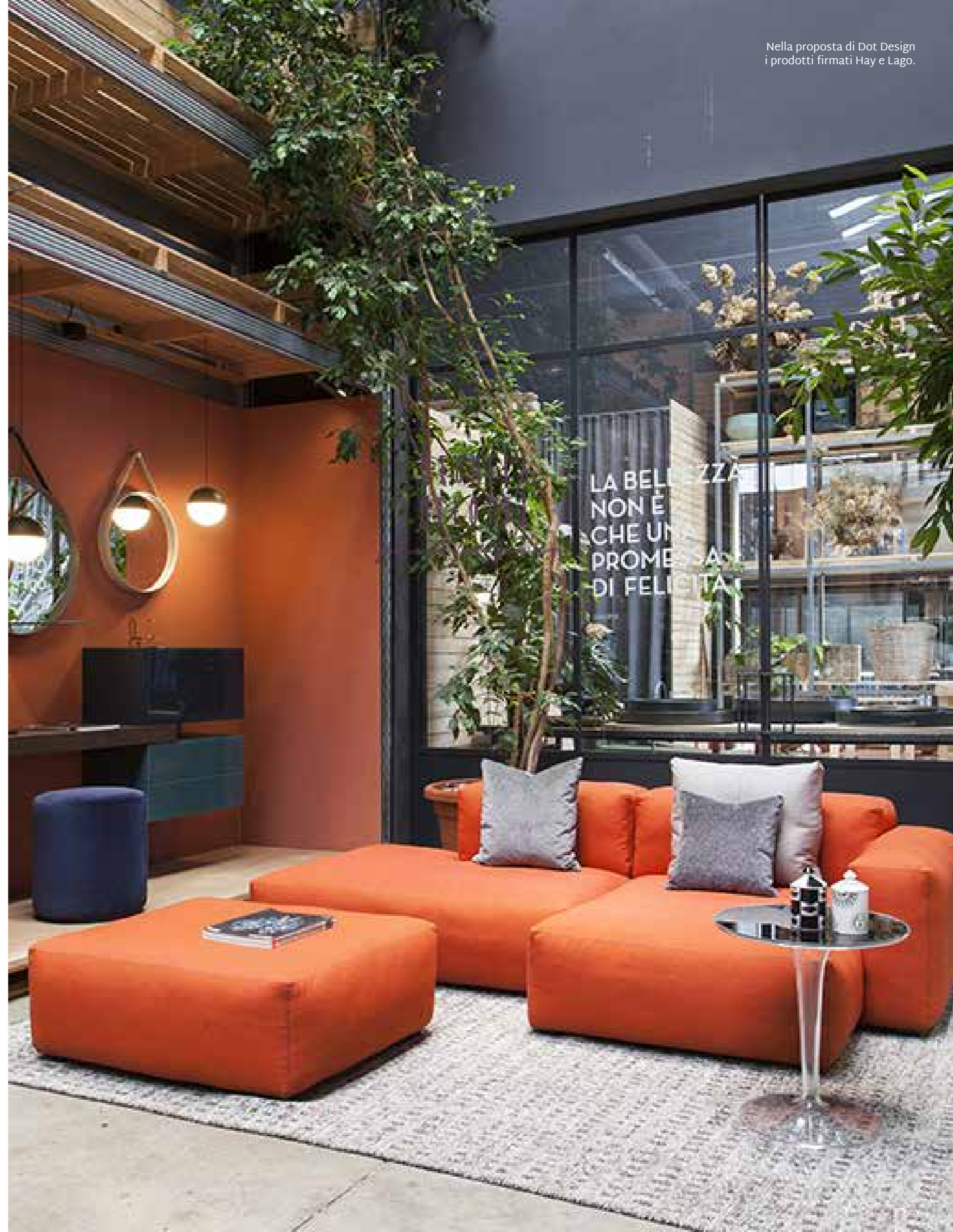
Nella proposta di Dot Design i prodotti firmati Hay e Lago.