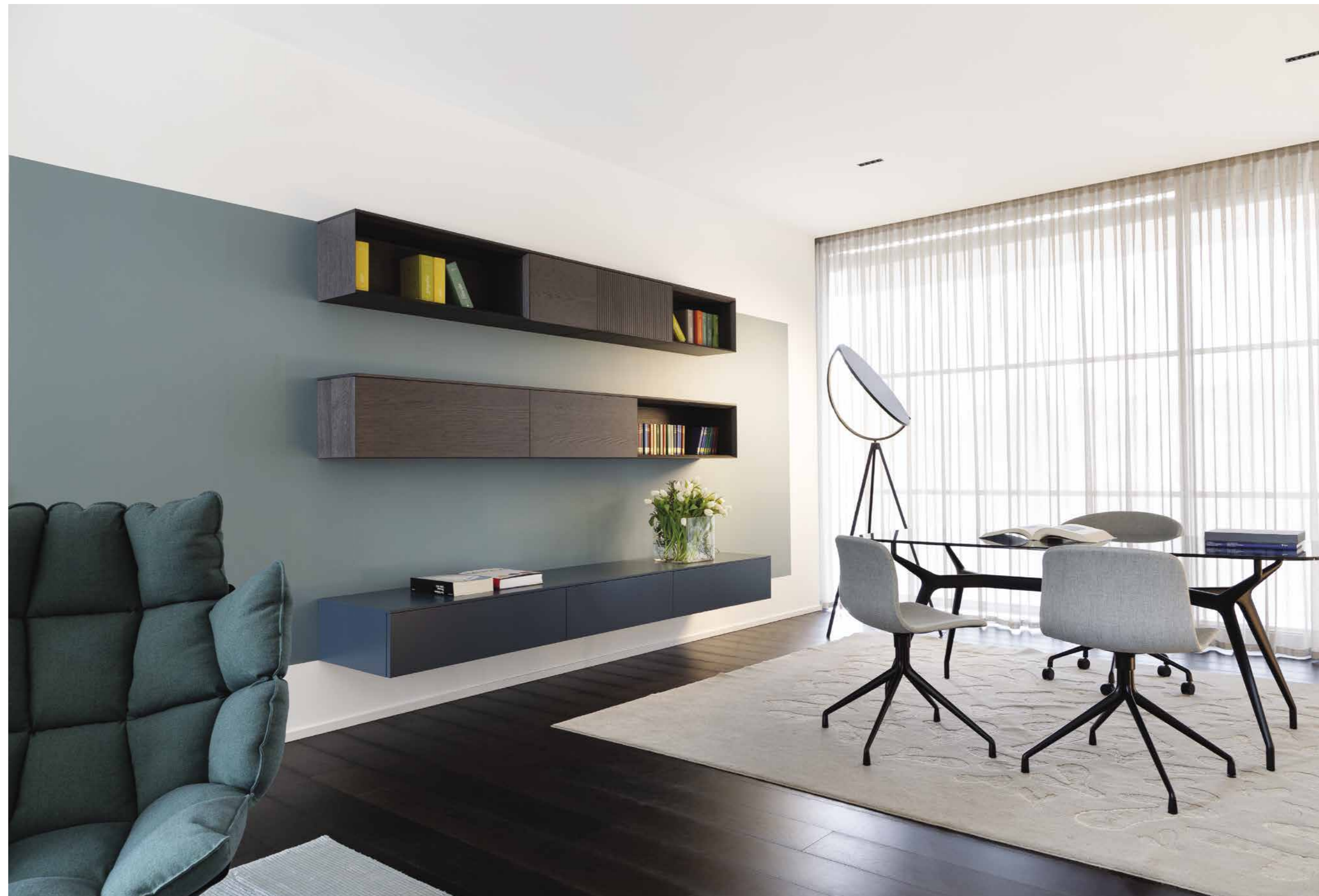
Luminoso e raffinato lo studio che si affaccia sul giardino della villa, è arredato con il tavolo dal piano in cristallo di Sovet con poltroncine Hay, tappeto disegnato da Diego Chilò e prodotto da Pasha. Lampada da terra Flos.