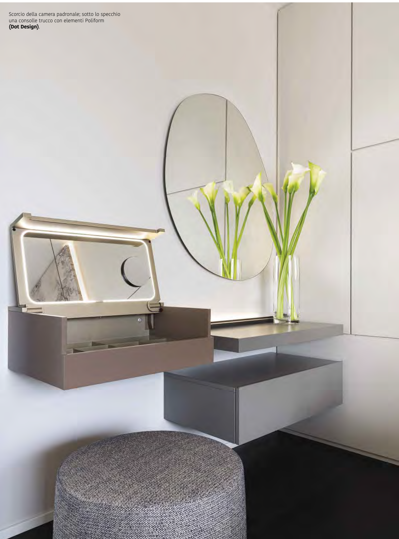
Scorcio della camera padronale; sotto lo specchio una consolle trucco con elementi Poliform ( Dot Design ).