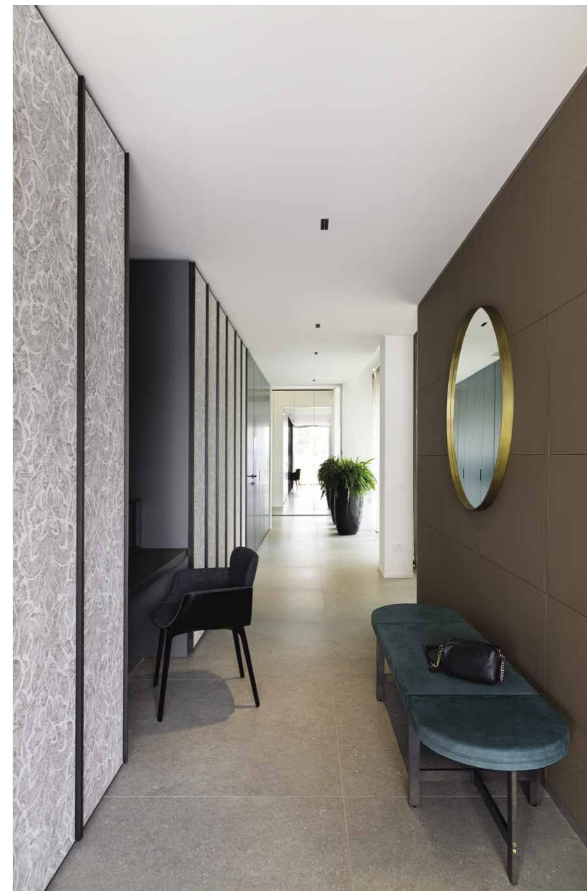
A sinistra: sala da bagno in marmo calacatta oro e pareti rivestite da carta da parati; mobile angolare sospeso realizzato su misura da Dot Design con doppio lavabo quadrato in appoggio e finitura di tendenza cannettata, illuminato da una lampada a sospensione di Davide Groppi. Dalla vasca freestanding si può godere dell'affaccio sul giardino privato ( Dot Design ). Sopra: corridoio splendidamente personalizzato da armadiature che accompagnano con ritmo il percorso, realizzate con ante rivestite con carta da parati. Panchina in pelle nabuk di Baxter e poltroncina di Knoll ( Dot Design ).