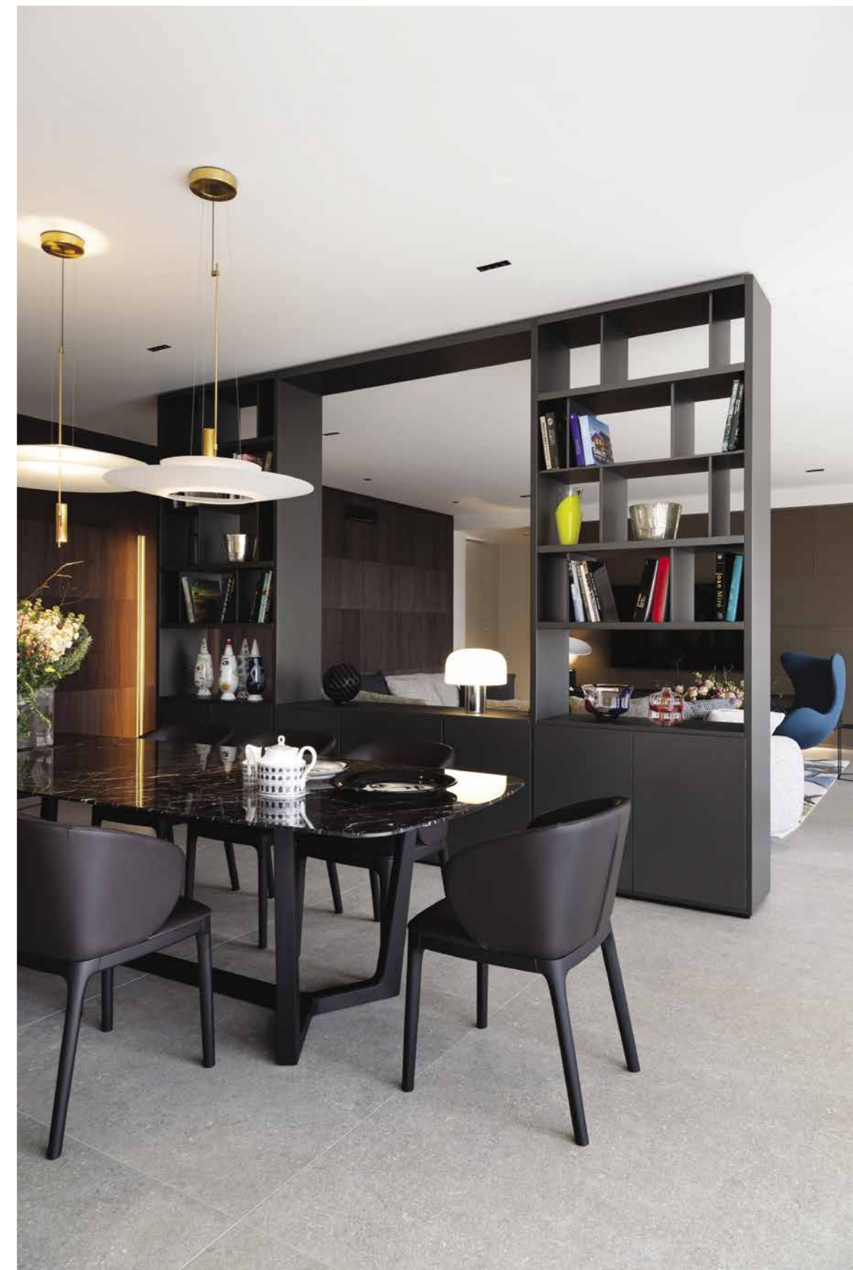
Un elegante tappeto disegnato da Diego Chilò produzione Pasha definisce questa zona con il divano Saint-Germain e la poltrona Egg Chair turchese di Fritz Hansen che aggiunge un piacevole accento di colore. Sullo sfondo una grande boiserie realizzata da Dot Design, Arignano-Vi , con una serie di pannelli 3D in noce canaletto. A destra: uno scorcio della zona pranzo con il tavolo in marmo nero e sedie in pelle di Poliform. Lampade a sospensione di Vibia, oggettistica e teiera Fornasetti di Shopping Casa.