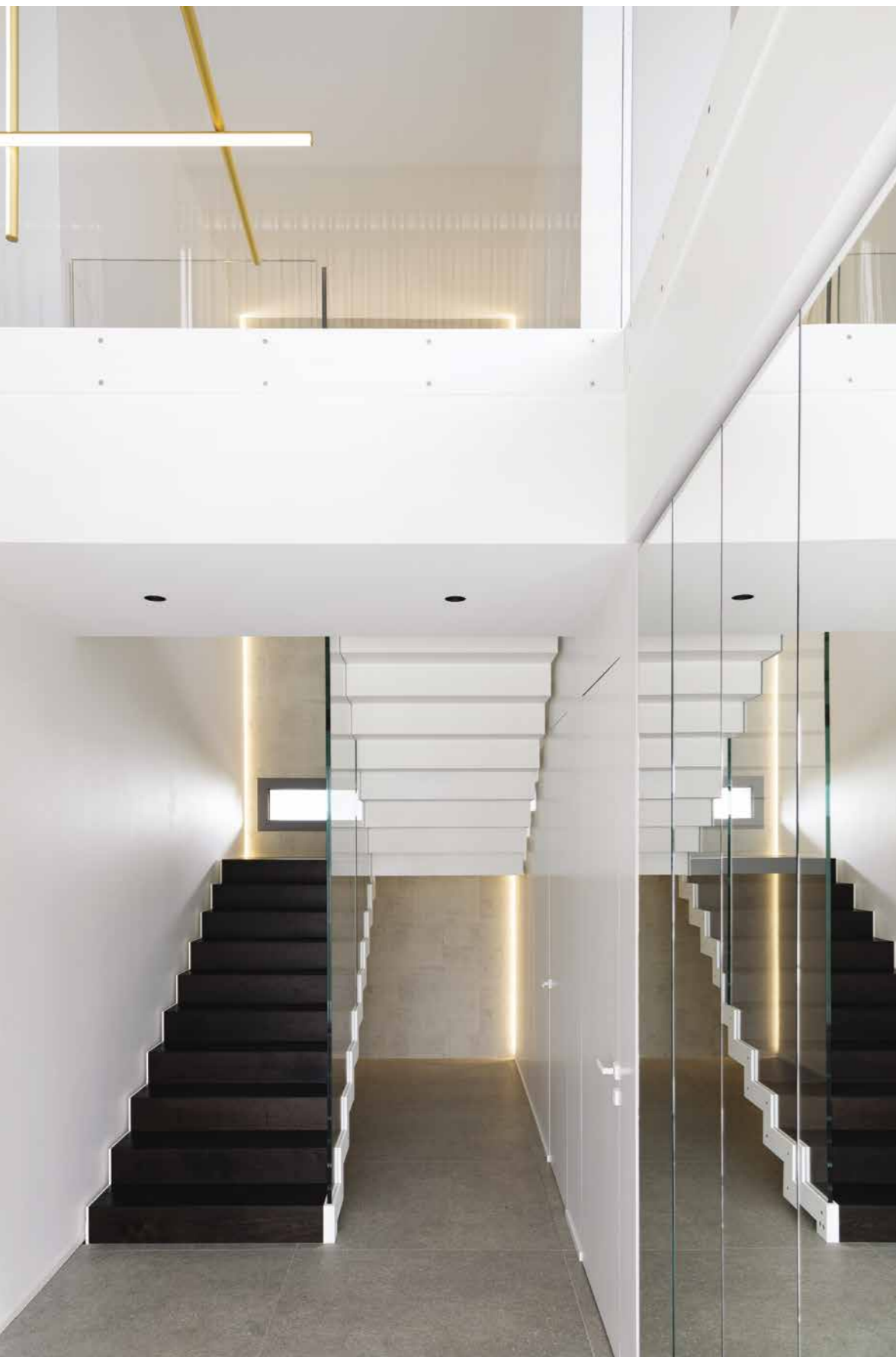
La scala che porta al primo piano è stata realizzata in metallo progettata da Studio C+Partners con barriera in cristallo come la parte balconata che profila il piano superiore. Lampade a sospensione Coordinates di Flos. Una parete con armadiatura a specchi rende più completa e luminosa questa zona di passaggio ( Dot Design ).