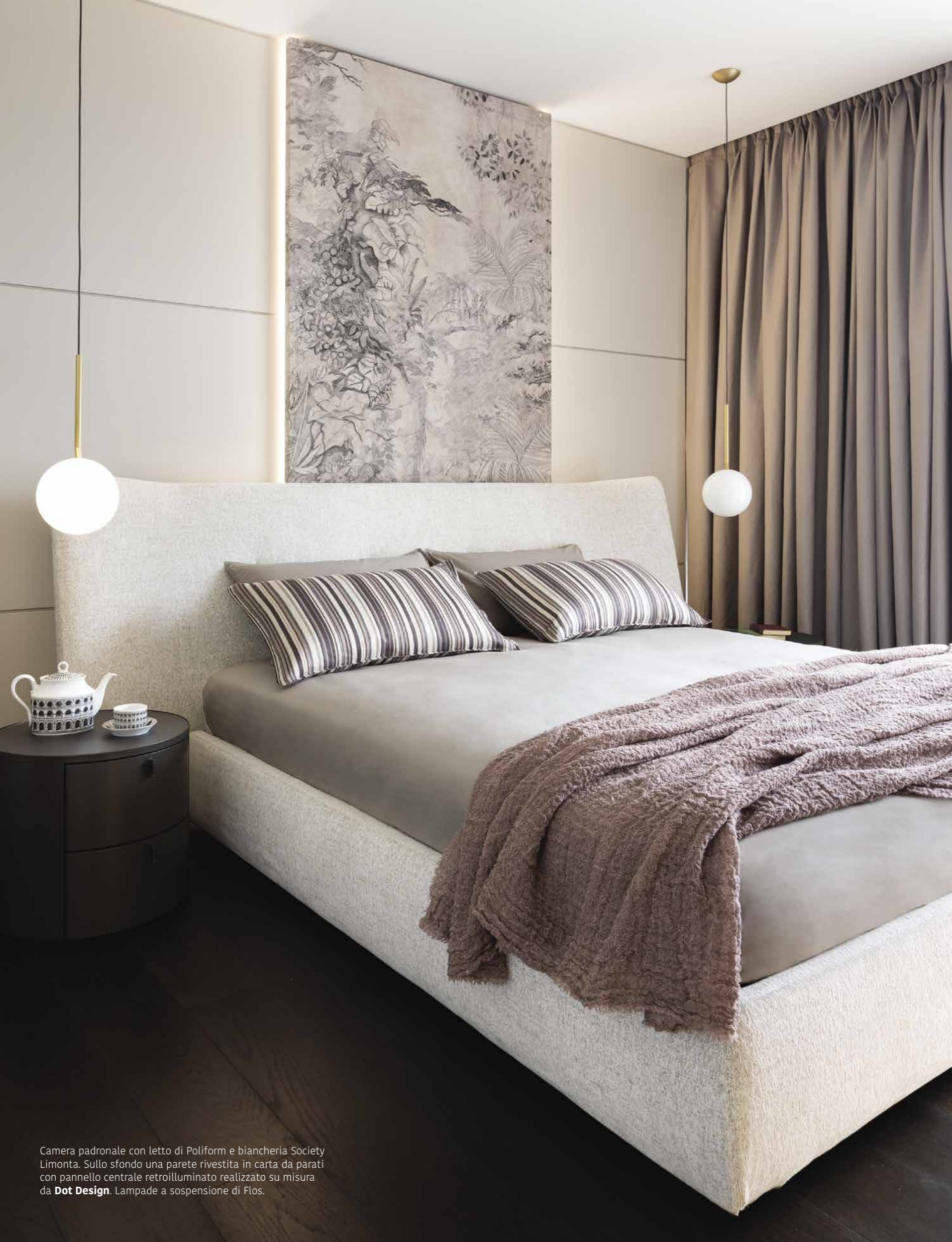
Camera padronale con letto di Poliform e biancheria Society Limonta. Sullo sfondo una parete rivestita in carta da parati con pannello centrale retroilluminato realizzato su misura da Dot Design . Lampade a sospensione di Flos.