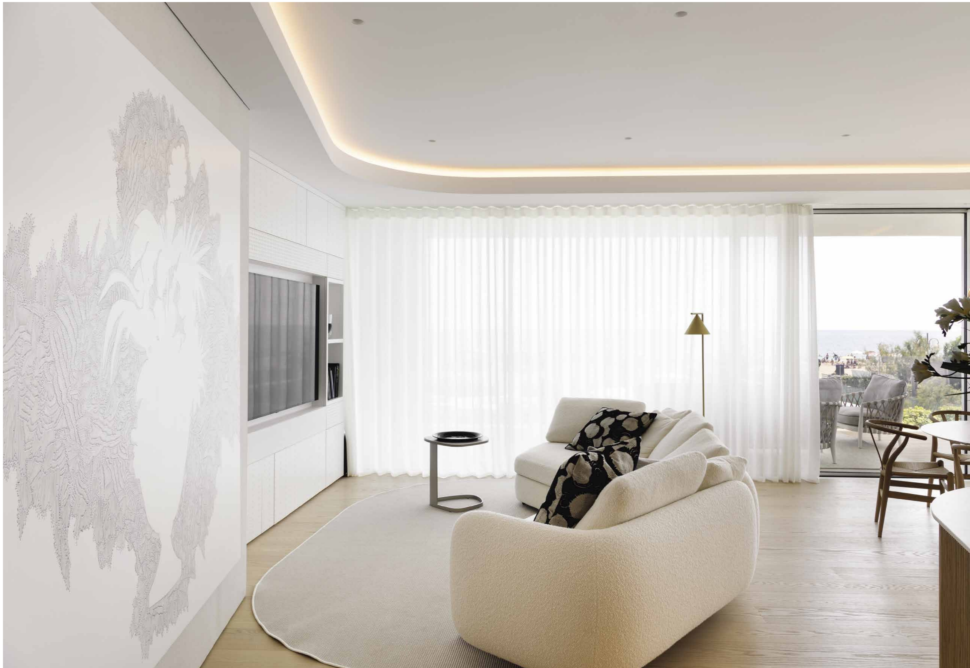
Luminoso e monocromatico, il living regala una sensazione di armonia e pace. Nella zona relax il divano Saint-Germain di Poliform rivestito in bouclé bianco, appesa alla parete una grande opera di Andrea Bianconi ( Dot Design ).