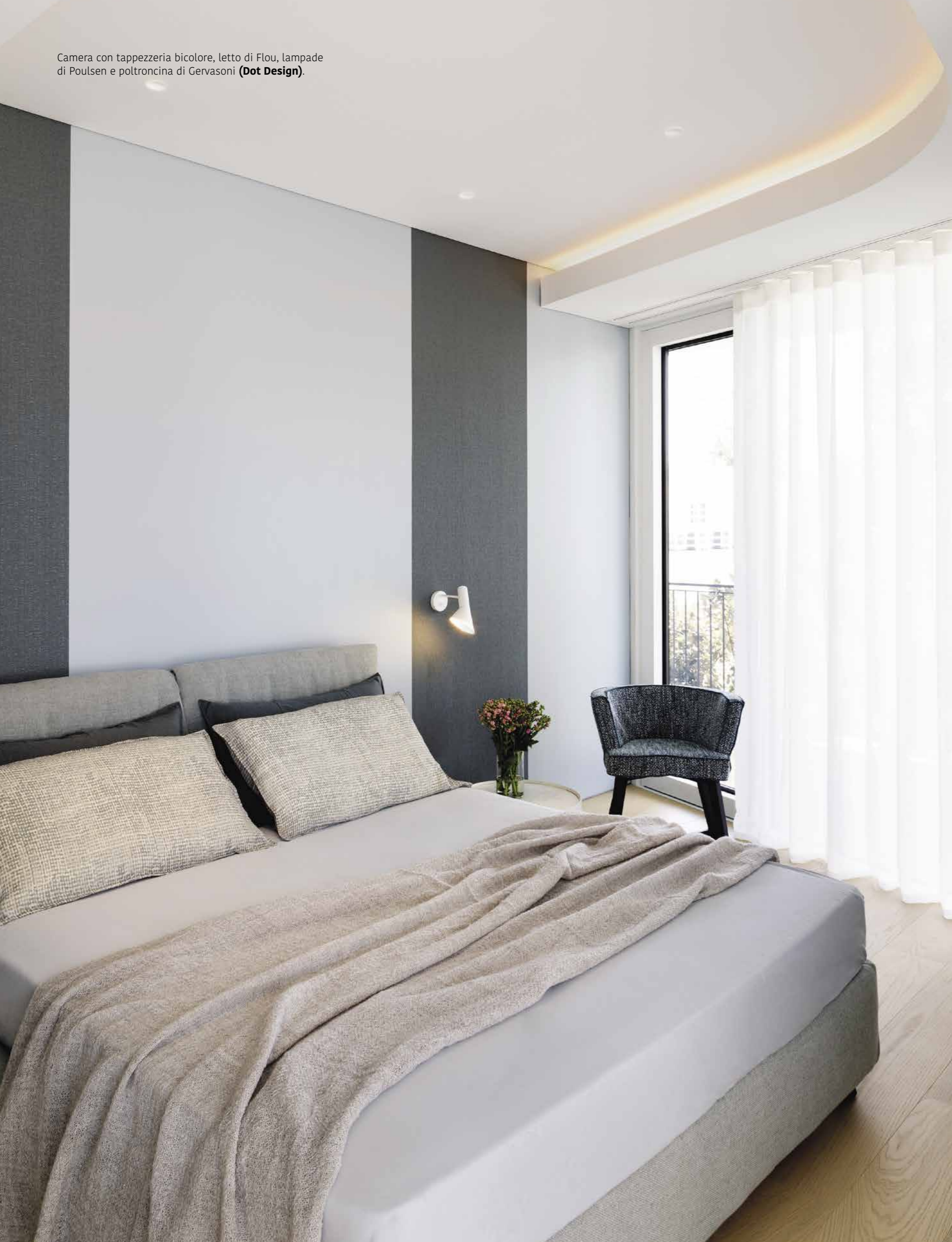
Camera con tappezzeria bicolore, letto di Flou, lampade di Poulsen e poltroncina di Gervasoni ( Dot Design ).