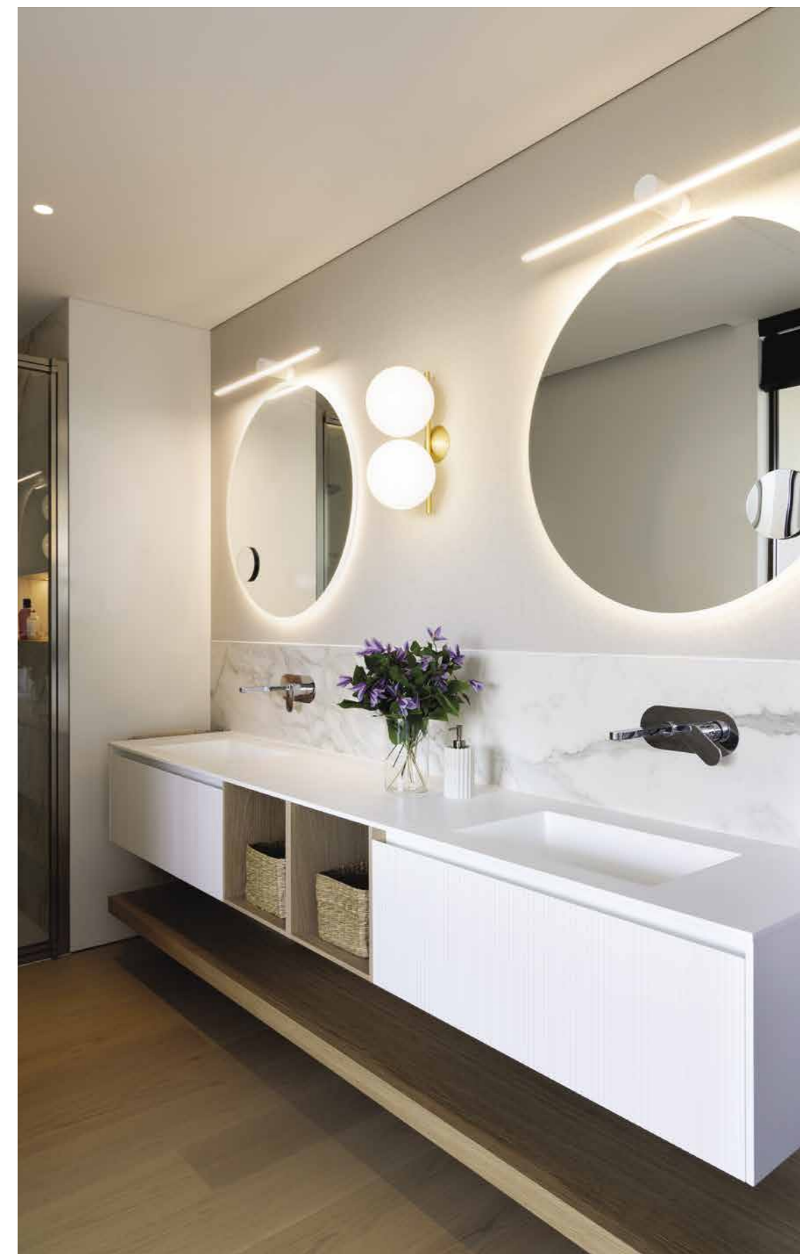
La camera padronale è realizzata con pannelli verticali retro letto rivestiti con tappezzeria e retroilluminati. Letto di Flou, lampade di Luceplan e bagno a vista con vetrate fumé ( Dot Design ). A destra: bagno padronale rivestito in marmo con doppio lavabo in Corian®, specchiere retroilluminate, lampade di Flos ( Dot Design ).