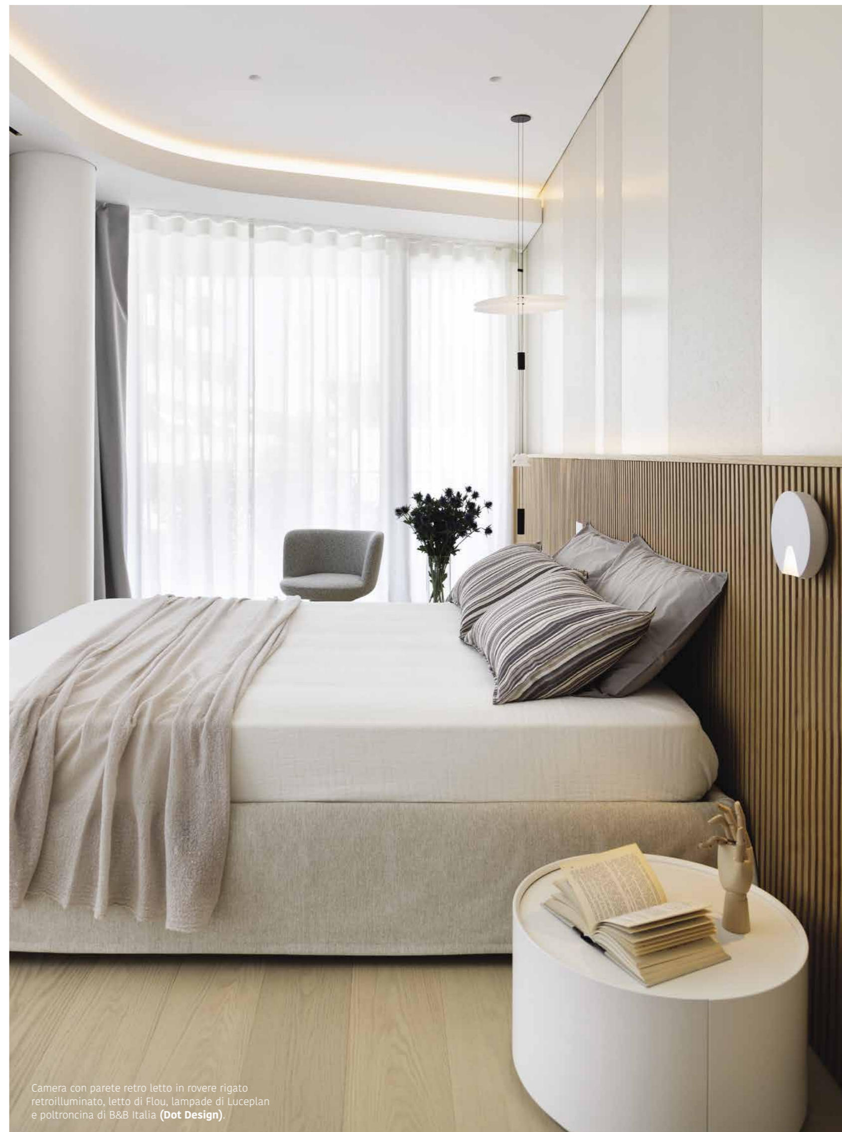
Camera con parete retro letto in rovere rigato retroilluminato, letto di Flou, lampade di Luceplan e poltroncina di B&B Italia ( Dot Design ).